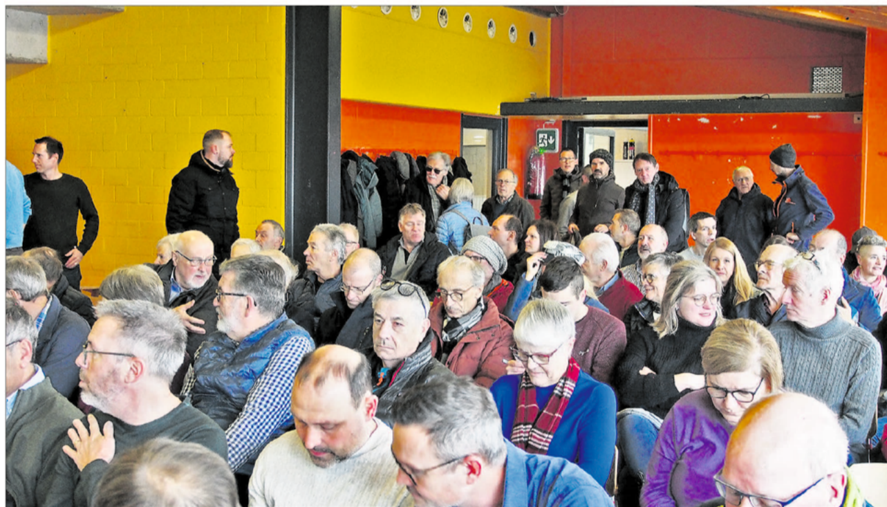
Grosses Interesse am vergangenen Samstagvormittag an der Informationsveranstaltung.

samt Schnitzelbunker auf dem Ygnis-Areal anbelangt, kann die Energie Ruswil Genossenschaft mit der Unterstützung der Gemeinde rechnen, ebenso was die Konzession für die Leitungsführung auf Gemeindegebiet betreffe. Hingegen könne die Gemeinde keine Fördermittel für die Umstellung von fossilen zu erneuerbaren Energieträgern ausrichten, dies sei, so Rolf Marti, Sache der kantonalen und nationalen Förderprogramme.